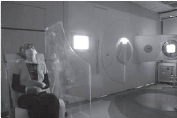
Şekil 1. Lateral ışınlama pozisyonu.

Hastanın oturur pozisyonunda iki yandan yapılan ışınlamada SAD 400 cm, gantri 82^\circ , kolimatör 00, alan 40 \times 40 \text{ cm}^2 'dir. Hasta ışık alanı içinde simetrik bir şekilde ve alan kenarlarına eşit mesafede pozisyonlandırıldı. Hastanın kolları akciğerleri koruyacak şekilde ve elleri de göbek hizasında birleşecek şekilde sabitlendi (Şekil 1).